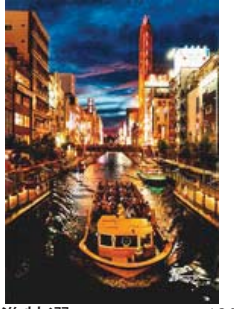
05 準特選 130-2/4 大阪商工会議所会頭賞 【たそがれの道頓堀】 島根県 佐伯 範夫