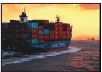
30 入選 259-1/3 近畿海事広報協会会長賞 【海の大動脈】 岡山県 白井 寛