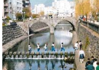
20 入選 141-1/2 近畿海事広報協会会長賞 【眼鏡橋 春の足音】 大阪府 神崎 勝