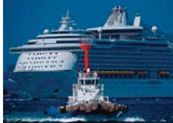
33 入選 295-1/2 近畿海事広報協会会長賞 【先導】 長崎県 富山 省吾