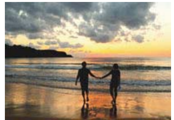
17 入選 115-2/3 近畿海事広報協会会長賞 【思い出】 和歌山県 鈴木 文代