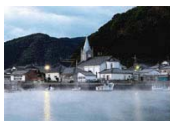
40 入選 369-3/4 近畿海事広報協会会長賞 【静かな目覚め】 熊本県 木原 進