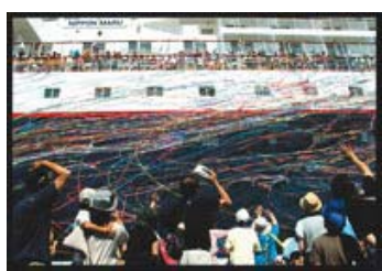
25 入選 216-1/2 近畿海事広報協会会長賞 【出航】 静岡県 山内 健