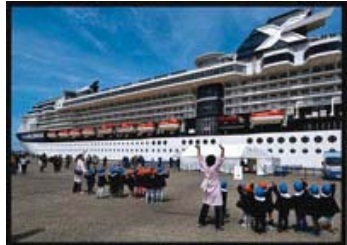
19 入選 134-2/3 近畿海事広報協会会長賞 【ようこそわが町へ】 新潟県 太田 誠二