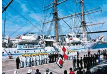
010 特別賞 198-6/6 大阪港開港150年記念賞 【大阪開港150年記念・海王丸出港イベント】 大阪府 脇森 茂隆