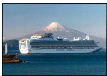
27 入選 242-1/6 近畿海事広報協会会長賞 【富士が見送り】 静岡県 望月 正晴