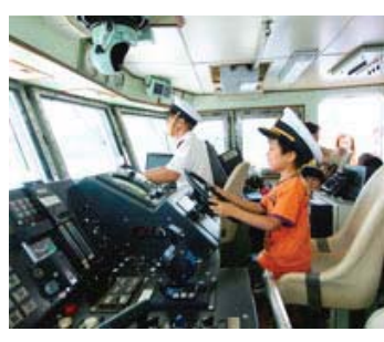
08 準特選 309-1/6 日本海事新聞社社長賞 【僕は船長】 愛媛県 松本 隆平