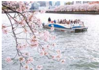
13 入選 41-3/4 近畿海事広報協会会長賞 【水都の春】 兵庫県 向井 章二