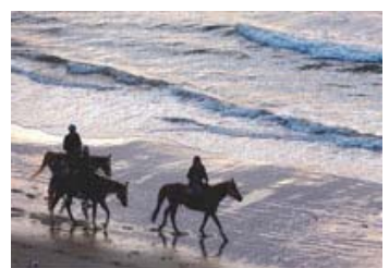
41 入選 (青少年) 49-1/1 近畿海事広報協会会長賞 【渚】 福岡県 いしばし 花音