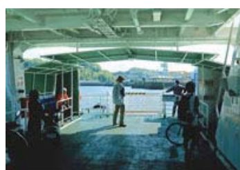
38 入選 353-2/3 近畿海事広報協会会長賞 【県道は海の上】 愛媛県 山台 雄三