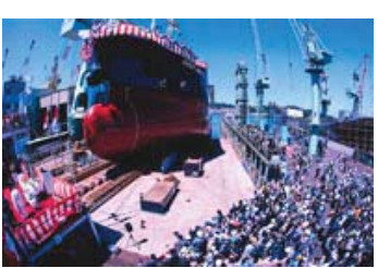
36 入選 334-5/9 近畿海事広報協会会長賞 【お披露目】 愛媛県 芝崎 静雄