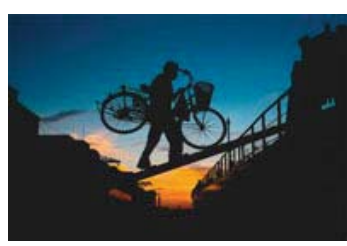
26 入選 236-2/3 近畿海事広報協会会長賞 【船に帰る時】 大阪府 山根 淳市