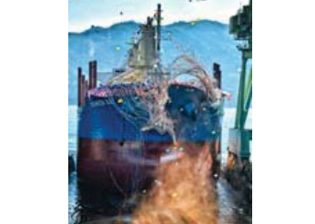
39 入選 368-2/3 近畿海事広報協会会長賞 【迫力の進水式】 愛媛県 長谷 由美