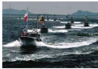
14 入選 56-2/2 近畿海事広報協会会長賞 【勇壮な船団】 愛知県 中山 俊夫