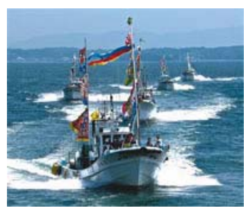
11 入選 25-2/4 近畿海事広報協会会長賞 【船団パレード】 愛知県 玉置 良宗