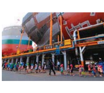
09 準特選 146-7/10 海事プレス社社長賞 【ワクワク ドキドキ】 宮崎県 松田 裕次